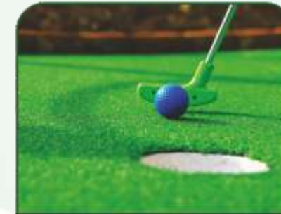
MINI GOLF GROUND