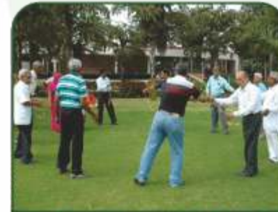
SENIOR CITIZEN PARK