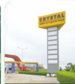
CRYSTAL LOGISTICS PARK-AMAZON