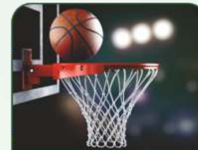
BASKETBALL COURT GROUND