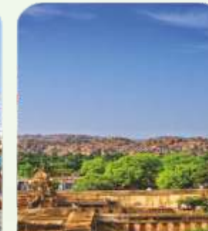
Lothal (Heritage Site)