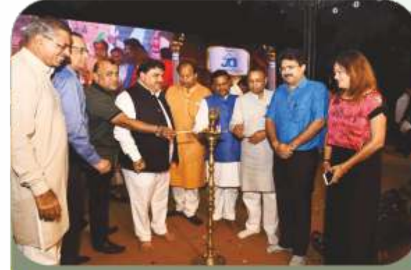
હેરીટેજસીટી પ્રથમ ડ્રોના દીપ પ્રાગટ્ય પ્રસંગે હાજર રહેલ મહાનુભાવો