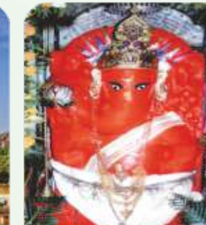
Ganeshpura (Koth) Temple