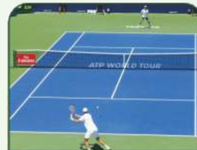
TENNIS COURT GROUND