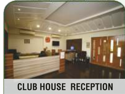
CLUB HOUSE RECEPTION