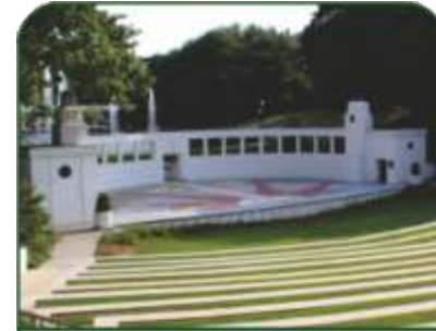
OPEN AIR THEATRE