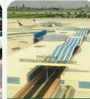
Dholera International Airport